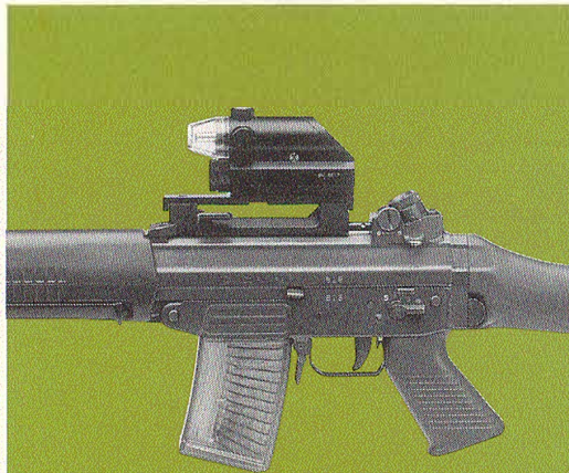
SIG SG 550

Adapter MP.5 132.538,0038 (+ Klemme 132,538.0039) (Schraube 932,482,3532)