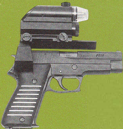
SIG/SAUER P 220