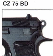
CZ 75 BD