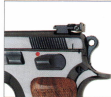
CZ 85 Combat