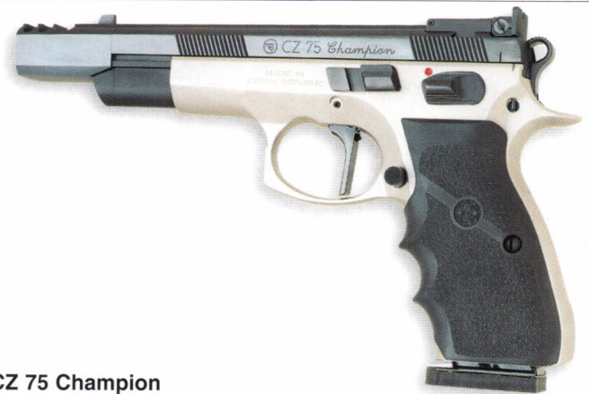
CZ 75 Champion

Die CZ 75 Champion im Kaliber .40 S&W wurde entsprechend der von der IPSC festgelegten Regeln für Schießwettkämpfe konzipiert. Die Waffe besitzt einen 3-Kammer Kompensator und einen verlängerten Magazinalteknopf. Das Visier ist in Höhe und Seite verstellbar. Der Sportabzug verfügt über Einstellmöglichkeiten für Druckpunkt und Triggerstop.