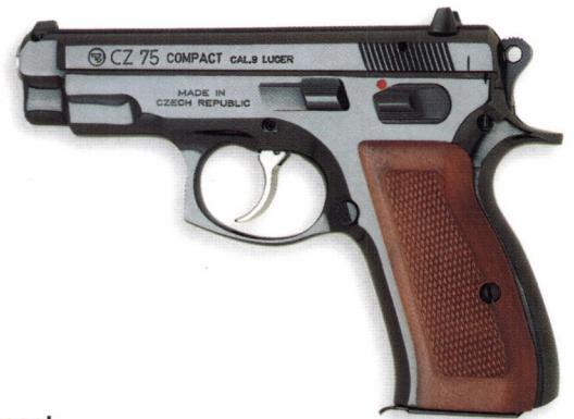
CZ 75 Compact

Die kompakte Version der CZ 75 besitzt einen um 20 mm verkürzten Verschluss und einen 10 mm kürzeren Griff. In bezug auf Leistungsfähigkeit, Zuverlässigkeit, Abmessungen und technische Parameter erfüllt diese Faustfeuerwaffe alle Anforderungen für die individuelle Verteidigung. Die Pistolen der Kompaktreihe verfügen serienmäßig über eine Schlagbolzensicherung.