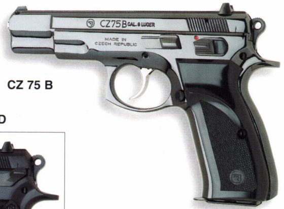
CZ 75 B

Die Vorteile: Einfache Handhabung, komfortables Schußverhalten mit serienmäßiger Schlagbolzensicherung, bequemer Griff und ein einzigartiges ergonomisches und elegantes Design. Die Pistole wird je nach Kundenwunsch in verschiedenen Oberflächenausführungen geliefert. Die CZ 75 BD ist anstelle einer manuellen Sicherung mit einem Entspannhebel versehen.