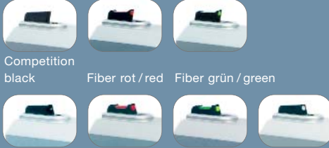
Competition black Fiber rot / red Fiber grün / green Standard black Fiber rot / red Fiber grün / green white dot