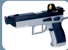
STS auf Verschluss montiert / mounted on slide